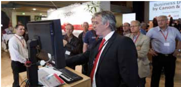
Im Fokus der Veranstaltung standen aktuelle Themen wie Crossmedia, Web-to-Print, Workflow und Social Media .

Einblicke und weitere Informationen zu den «Business Days by Canon & Océ» in Zürich, Lausanne und Bern sind unter www.businessdays.ch ersichtlich. ■